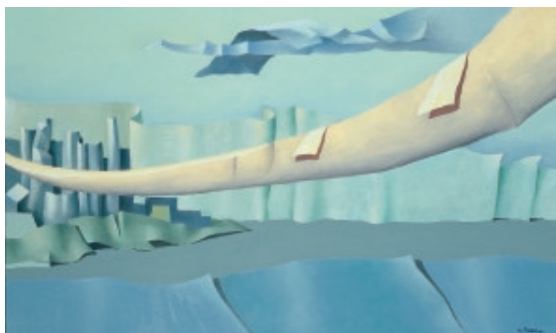
Ponte in città 100x60 cm olio su tela